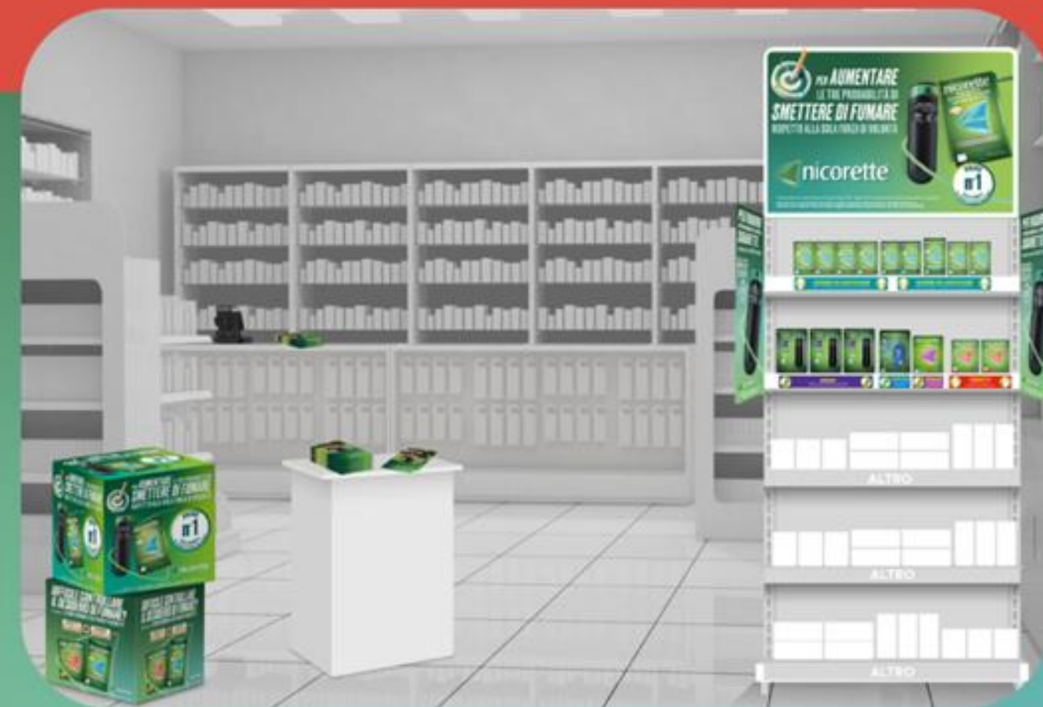
Immagine al solo scopo esemplificativo